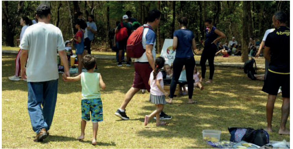
Ação acontece no dia 14 de junho, no campus Pampulha.

A última edição do Domingo no Campus foi realizada em setembro de 2025, em comemoração aos 98 anos da UFMG e aos 10 anos do projeto. Na ocasião, cerca